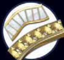
Рельсовый каст и фаден