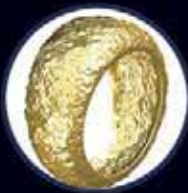
3D текстуры и барельеф