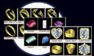
Каталог компонентов (включает CRYSTALLIZED™ Swarovski)