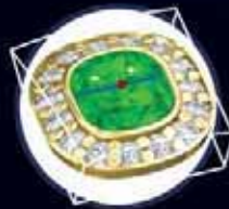
Деформации и морфинг